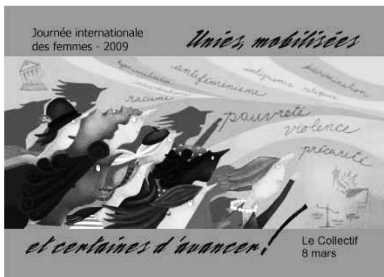
Huguette Latulippe / Promotion inc., Illustration: Marie-Eve Tremblay, colagene.com

À l'occasion de la journée internationale des femmes, le comité femmes vous a concocté un numéro spécial de votre bulletin syndical. Nous imitons en cela nos consœurs qui avaient initié cette démarche en mars 1997, jamais reprise depuis. En reprenant leur flambeau, nous espérons instaurer une tradition qui se répètera au fil des années.