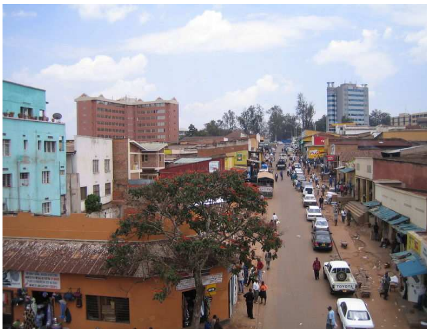
Centre-ville de Kigali, Rwanda

L'association SEVOTA a été fondée en 1994 après le génocide au Rwanda. Notre mission est de soutenir les femmes et les orphelins rescapés du génocide en les aidant à développer des capacités d'analyse et de recherche de solutions dans le but d'améliorer leurs conditions de vie et celles de leur communauté.